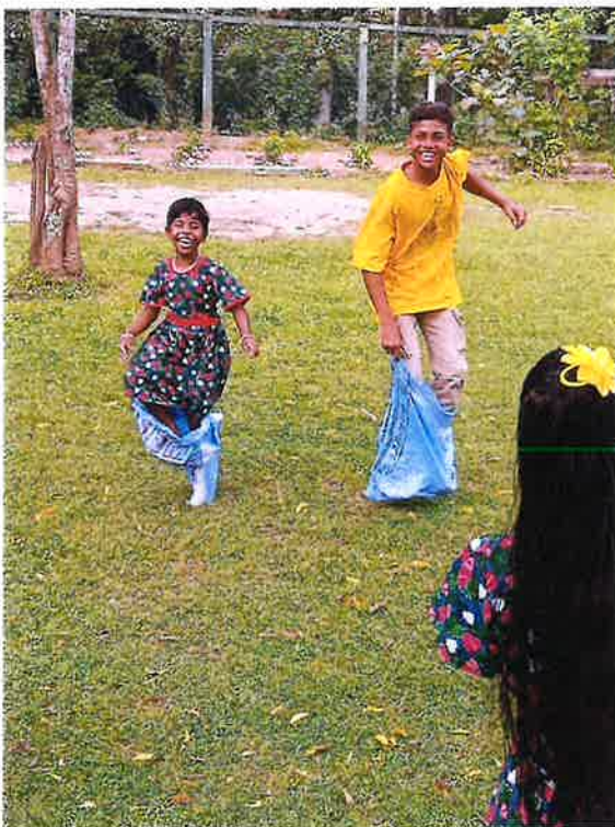
Sackhüpfen für Groß und Klein