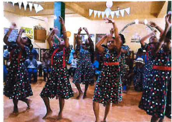
Eliya feiert 11-jähriges Jubiläum!