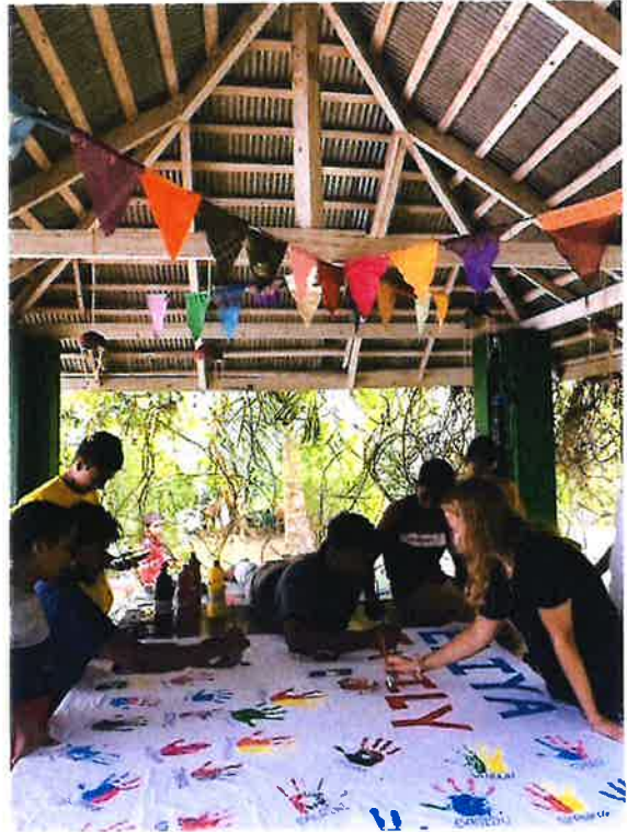
Viele bunte Handabdrücke...